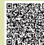
《明報》「談天說地」 讓每一個孩子都能夢想飛行