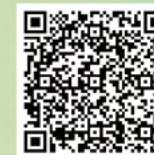
《信報》 傳承「山狗校長」理念