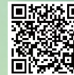
《明報》 沙燕隊校長：學生不應只讀書