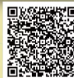
《明報》「談天說地」 心繫山區學童的山狗校長